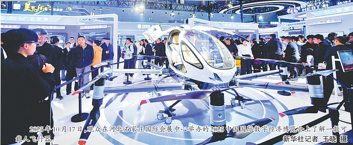
2025年10月17日,观众在河北石家庄国际会展中心举办的2025中国国际数字经济博览会上了解一款可载人飞行器。