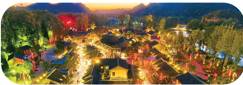
「恋乡·太行水镇」夜景。

本报讯(牛琪 冯小青)11月18日至21日,联合国“文化创新与城市可持续发展论坛”及2025年度“世界康养城市”试点终期评审会在土耳其伊斯坦布尔举行,经过四天评审,中国保定“恋乡·太行水镇”与马耳他“比尔古古城”、法国“圣埃蒂安老年城”项目一道,共同获评本年度“世界康养城市”项目类试点并列入“国际康养交流实践基地”。 据了解,“世界康养城市”试点是全球范围首个国际化标准的康养城市示范建设项目,由联合国国际老龄组织2024年4月全球推出并官方认可、联合国国际老龄组织国际专家委员会携手由联合国教科文组织国际人文科学中心等组织实施和审核认定,旨在推动一批全球先锋城市率先应用联合国“康养城市评价标准”并开展创新实