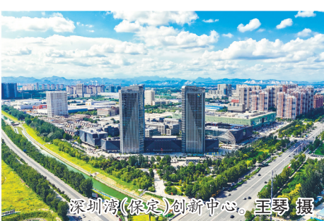
深圳湾(保定)创新中心。

科技成果转化是连接科技创新与产业发展的“最后一公里”,也是将科学技术转变为现实生产力的关键环节。 为解决科技成果与市场需求“脱节”的问题,保定创新搭建供需对接平台,让成果和需求精准匹配。一方面,持续推进“揭榜挂帅”机制,面向企业技术难题发布榜单,吸引国内外优质创新资源前来“揭榜”。“十四五”期间,保定累计发布12批次319个“揭榜挂帅”榜单,涵盖电力装备、新能源、智能网联汽车等多个领域,其中153个榜单成功揭榜,90个榜单获得立项支持,支持资金达3850万元,有效撬动企业研发投入4.67亿元。另一方面,保定建立“双推送”机制,定期发布《科技成果转化供给清单》和《企业需求清单》,将高校、科研院所的科技成果与企业的技术需求双向推送,让校企合作更精准、更高效。 平台是成果转化的“孵化器”。保定着力建强中试转化、技术转移、交易展示三大平台,为成果落地提供全链条保障。在中试转化方面,全市已建设12家中试基地,其中乐凯功能膜材料中试基地被纳入省中试示范平台培育库,与北京中科老专家技术中心共建的中试产业基地实现中试资源柔性共享,有效解决了科技成果从实验室到生产线的“中试瓶颈”。在技术转移方面,培育21家省级技术转移机构,组织开展初、中、高级技术经理人培训,全市技术经理人队伍达到700人,成为连接科技成果与市场的“专业红娘”。在