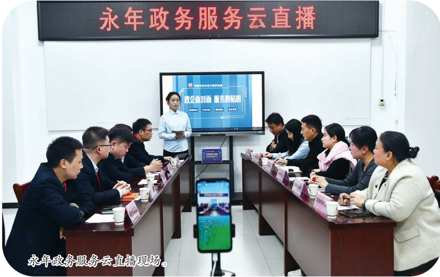
永年政务服务云直播现场。

上档提级,从“单次活动”到“品牌矩阵”。政务服务云直播在政策深度解读、办事流程详解及优质企业推介三大板块基础上不断创新突破,构建起“服务多元