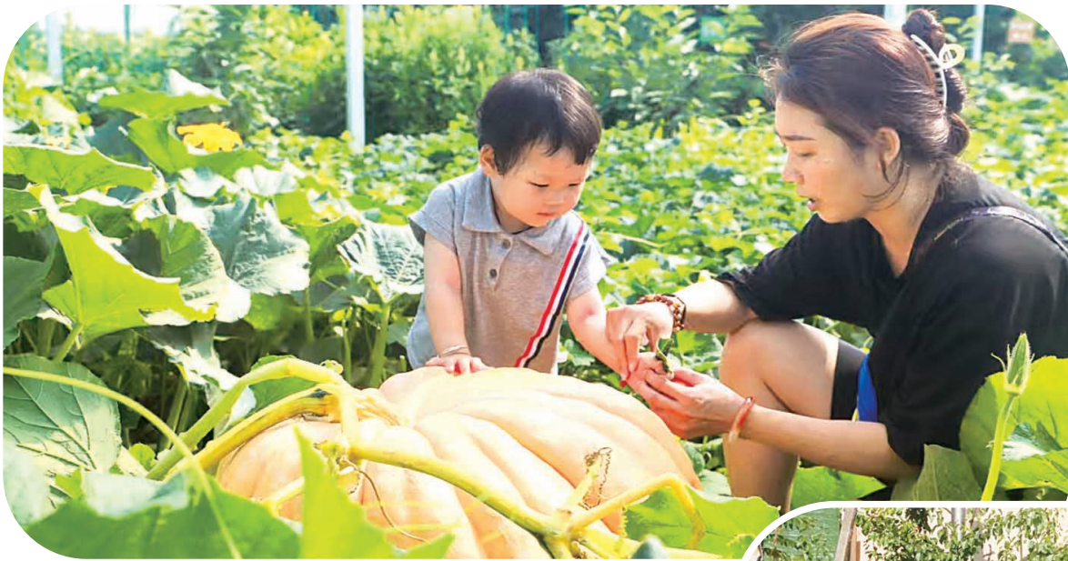
◀五墩台村西旺农乐园吸引游客采摘。(资料片)

不远处的五墩台村,科技正为传统农业插上“翅膀”。走进西旺农乐园,9个高标准设施农业大棚一字排开,棚内草莓、西红柿等果蔬长势喜人,游客们提着篮子穿梭其间,不时发出“草莓真甜”的赞叹。而在新建的“光导气候舱”研学基地,孩子们正围着舱体好奇打量:舱内层层叠叠的种植架上,嫩绿的芽菜生机勃勃,技术员按下按