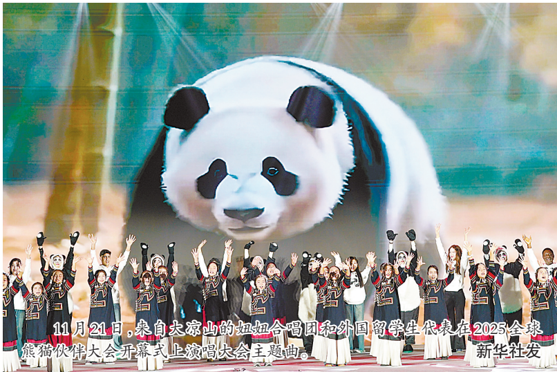
11月24日,来自爱慕山的如加合唱团和外国留学生代表在2025全球熊猫伙伴大会开幕式上演唱大会主题曲。

贡献了全球环境治理的新方案。习近平生态文明思想坚持运用系统观念和系统思维,强调生态是统一的自然系统,是相互依存、紧密联系的有机链