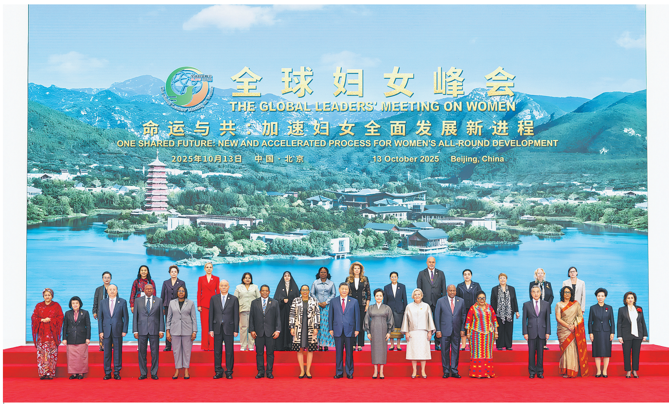
10月13日上午,国家主席习近平在北京国家会议中心出席全球妇女峰会开幕式并发表主旨讲话。这是习近平和夫人彭丽媛与会各国和国际组织代表团团长夫妇合影留念。

新华社北京10月13日电(记者马卓言 董博婷)10月13日上午,国家主席习近平在北京国家会议中心出席全球妇女峰会开幕式并发表主旨讲话。