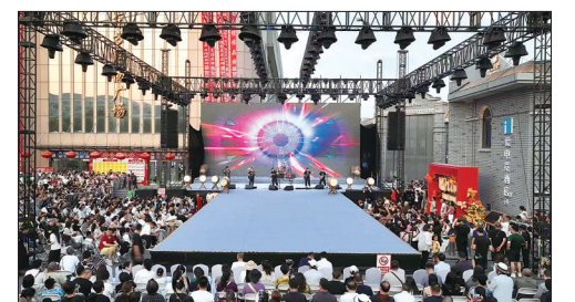
近日,“凤舞建国内,雀韵启新章”主题活动在唐山建国内文旅街区启幕,为唐山市民带来一场沉浸式的云南风情体验。图为活动现场。

活动现场,古冶区应急管理局、住建局、交通运输局等单位通过设立咨询台、悬挂宣传横幅、陈列展板和发放宣传明白纸等多样化形式,围绕用气规范、防灾减灾技巧、食品药品安全等重点领域,宣传安全生产政策法规、应急避险和自救互救方法,向群众普及安全知识。活动当天共发放各类安全宣传资料5000余份,陈列宣传展板40余块,悬挂宣传条幅25条,解答群众咨询100余条。