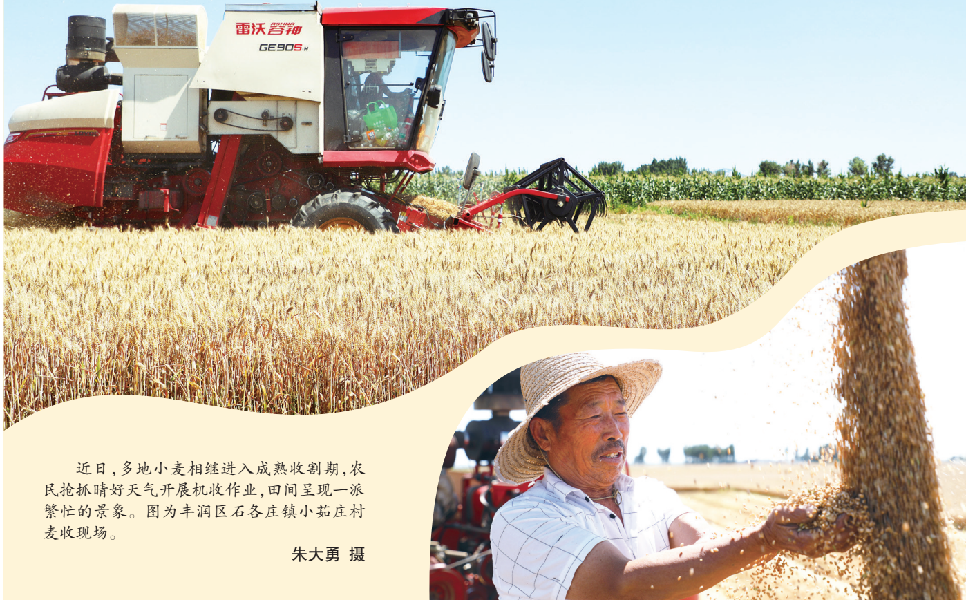
近日,多地小麦相继进入成熟收割期,农民抢抓晴好天气开展机收作业,田间呈现一派繁忙的景象。图为丰润区石各庄镇小茹庄村麦收现场。