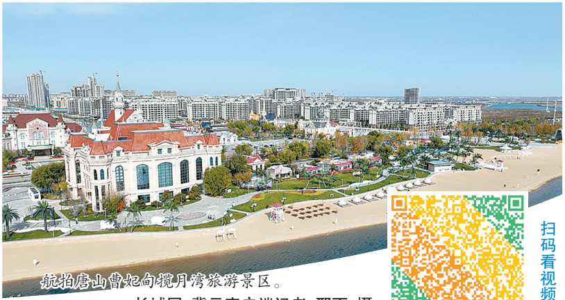
航拍唐山曹妃甸月亮湾旅游景区。