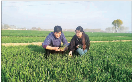
为了切实强化小麦田间管理,夯实丰产基础,近日,涑水县农技人员深入到下庄村、南王庄等村田间地头开展技术指导服务,实地察看小麦苗情长势,提出管理建议,提醒农户根据田间杂草种类选择适宜除草剂,以免发生药害。图为农技人员深入田间察看小麦苗情。

本报讯(通讯员李柳)近日,博野县2024年“奥运冠军之城杯”U系列陆地冰壶比赛在该县职业技术教育中心举行,来自全县中小学18支代表队的100多名青少年参加了比赛。经过紧张激烈的角逐,最终,程委镇中心校、同连中学分别斩获小学组、初中组冠军。此次竞赛活动提高了青少年对冰壶运动的兴趣和认识,为推动冰壶运动在博野县的普及和发展奠定了坚实的基础。 下一步,博野县将继续举办更多高质量的体育赛事和活动,为广大体育爱好者提供更多的参与机会和展示平台,推动博野县体育事业的持续健康发展。