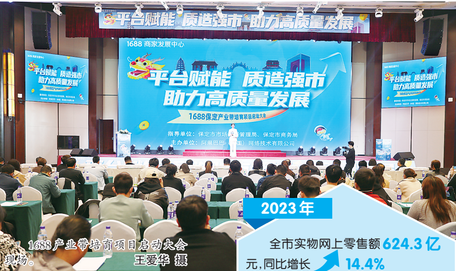
1688产业带培育项目启动大会现场。

本报讯(通讯员杨虎 黄汇雨)4月6日,从保定市市场监督管理局获悉,保定市创建全国网络市场监管与服务示范区成效初显。2023年,全市实物网上零售额624.3亿元,同比增长14.4%,分别高于全国、全省6.0、6.3个百分点,占社会消费品零售总额的比重为38.2%,分别高于全国、全省10.6、10.2个百分点。进出口总额714.1亿元,同比增长61.2%,增速全省第一;邮政行业寄递业务量全年累计完成17.70亿件,同比增长22.46%,快递业务量排名位居全省城市第1位、全国城市第19位,带动约900亿元保定产品外销。