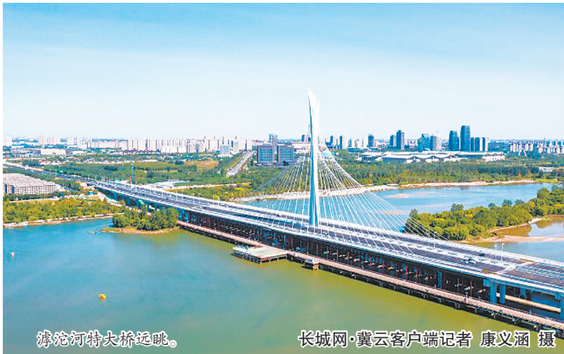
滹沱河特大桥远眺。