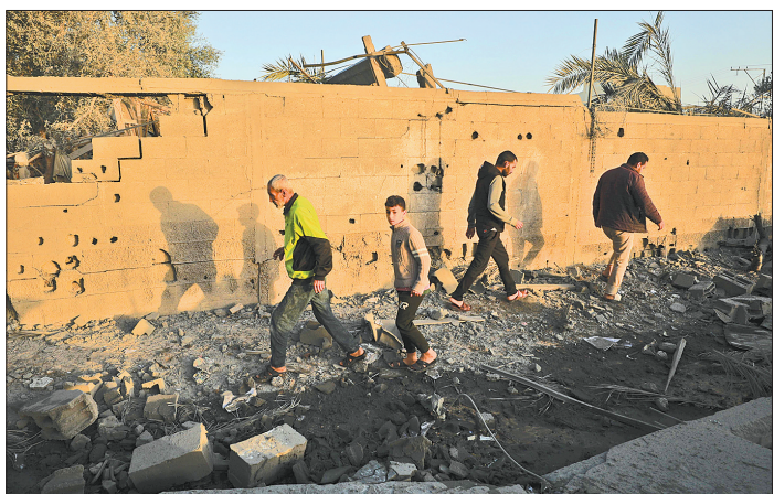
11月23日,在加沙地带南部的尤夫尼斯,人们从以军袭击后破损的街头走过。当地时间11月24日上午7时(北京时间13时),巴勒斯坦伊斯兰抵抗运动(哈马斯)和以色列在加沙地带的停火协议正式生效。

据国家发展改革委监测,全国平均猪粮比价连续三周以上运行在5:1至6:1之间,处于《完善政府猪肉储备调节机制 做好猪肉市场保供稳价工作预案》确定的过度下跌二级预警区间。