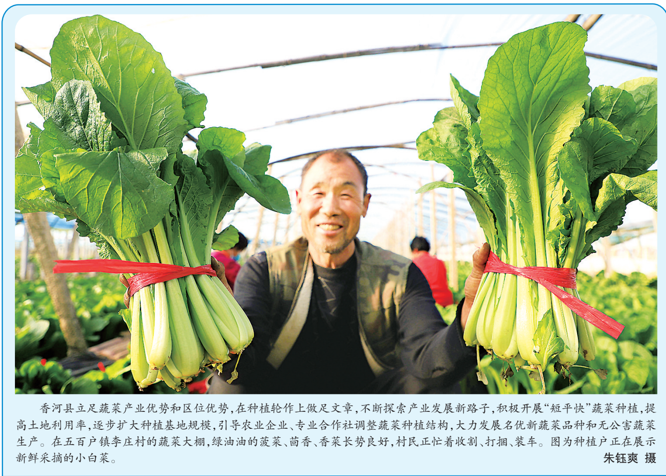
香河县立足蔬菜产业优势和区位优势,在种植轮作上做足文章,不断探索产业发展新路子,积极开展“短平快”蔬菜种植,提高土地利用效率,逐步扩大种植基地规模,引导农业企业、专业合作社调整蔬菜种植结构,大力发展名优新蔬菜品种和无公害蔬菜生产。在五百户镇李庄村的蔬菜大棚,绿油油的菠菜、茴香、香菜长势良好,村民正忙着收割、打捆、装车。图为种植户正在展示新鲜采摘的小白菜。

本报讯(通讯员蔡雨杰)近日,廊坊市广阳区市场监督管理局组织开展了食品行业首席质量官制度推广工作会议。会上,工作人员就食品行业首席质量官制度建设相关要求做了安排部署。该局在全区食品行业确立了30家食品生产和餐饮业龙头企业作为重点培育对象,截至目前,已有12家企业成功引入了首席质量官制度。