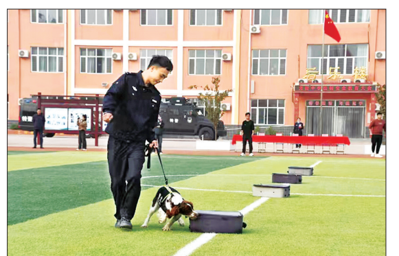
日前,文安县公安局联合县教育和体育局在龙街中学开展了“多彩警营进校园,警校携手护成长”活动,有效提升在校学生的法律意识、防范意识、安全意识和自我保护能力。图为搜救犬搜爆训练。

本报讯(通讯员金胜利 张艺典)大城县人民法院深耕县域文化,健全体系、服务基层,创新打造了“平纠纷、舒民心、法为桥”的“平舒法桥”多元解纷品牌,营造了共建共治共享的社会矛盾纠纷源头治理新格局。大城县人民法院主动连接公安、司法、律协等多部门团体,充分应用“一庭两所”矛盾纠纷联调机制,构建以人民法庭为中心,纵向延伸至乡镇、村街,横向对接司法所、派出所等综治单位的基层解纷服务体系;县域各乡镇设立法官工作室,人民法庭设立人民调解员工作室,指导金融保险业调解委员会调解工作;建立调解组织和调解员名册,制定考核机制,不定期进行业务培训,提高调解水平。