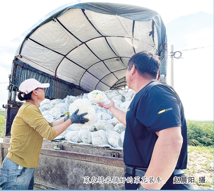
菜农将采摘好的紫花装车。赵晨阳 摄

品牌”的新型种植模式,新建马铃薯标准化示范基地200亩,辐射带动周边马铃薯种植农户提档升级,实现“减量增效”的总体目标。