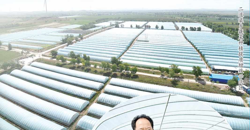
二道渠乡蔬菜种植提质增效示范区。

延链补链,富农增效。二道渠乡积极谋划蔬菜种植提质增效示范区,采取“公司+合作社+农户”的发展模式流转村集体土地180亩,投资420万元新建高标准春秋大棚168座,主要种植线椒、扁豆、芹菜等精细