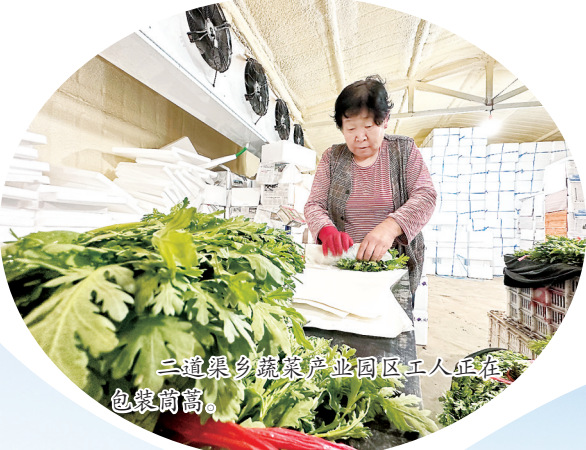
二道渠乡蔬菜产业园区工人正在包装茼蒿。