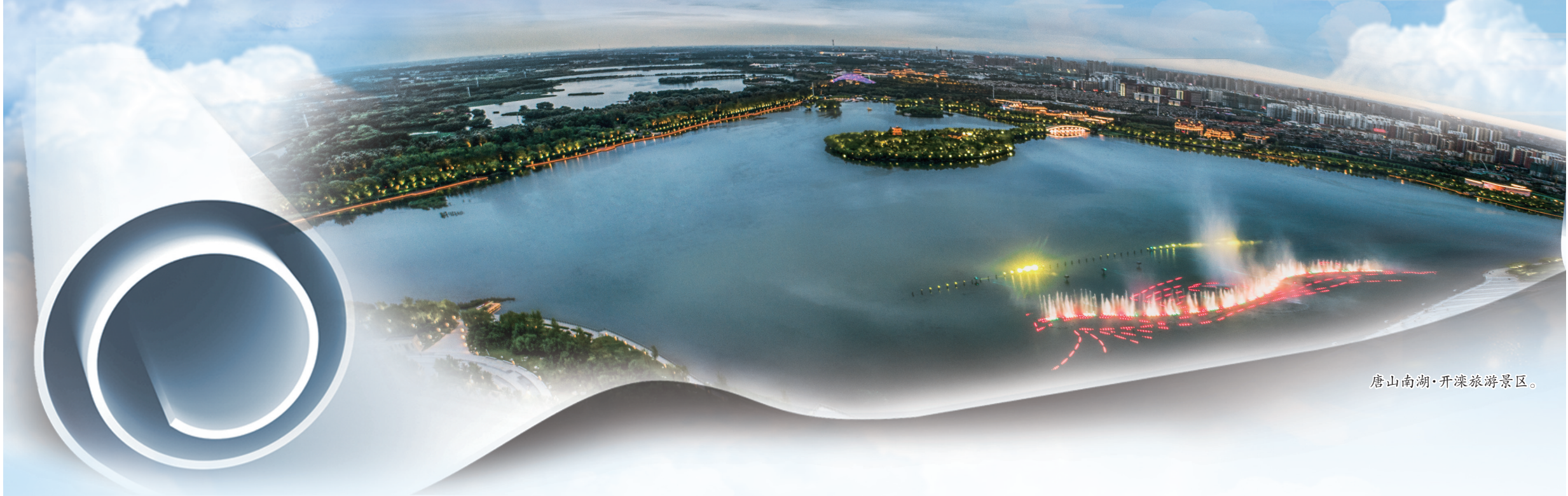
唐山南湖·开滦旅游景区。

晨光熹微中，绕着大城山“运动之城”来一圈慢跑，让身心在运动中活力开启；夜幕降临，在南湖之畔观看一场光影水舞秀，体验声、光、电带来的震撼……近年来，唐山着力优化旅游产业结构，提升旅游产品品质，健全公共服务体系，加强品牌宣传推介，推动全域旅游发展，绘就“诗和远方”新画卷，做好文旅融合大文章。