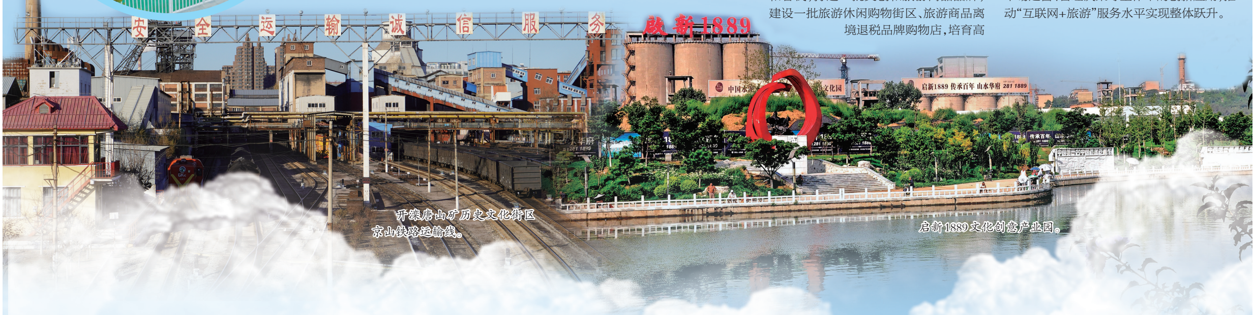
开滦唐山矿历史文化街区 京山铁路运输线。