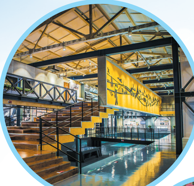
唐山工业博物馆内景。

据介绍，唐山市将持续增强旅游科技支撑力，推动智慧旅游城市、智慧旅游景区建设，培育更多智慧旅游创新企业和示范项目，引导云旅游、云直播等新业态发展。同时进一步强化旅游大数据研究应用，推动大数据、人工智能、区块链等新技术在旅游信息服务、市场运营、管理决策等工作中的创新应用，推动“互联网+旅游”服务水平实现整体跃升。