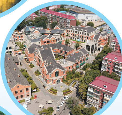
培仁历史文化街区。