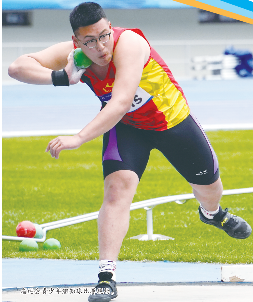
省运会青少年组铅球比赛现场。