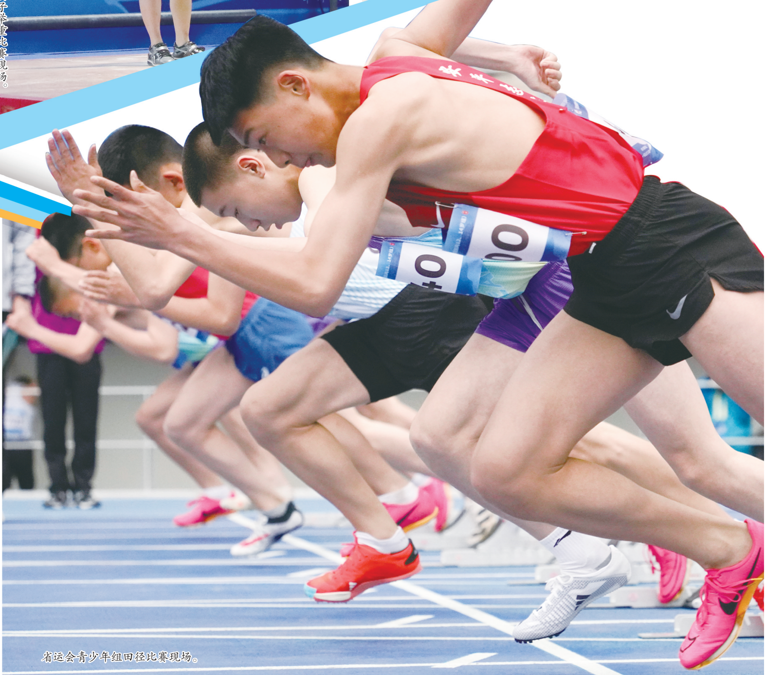
省运会青少年组田径比赛现场。