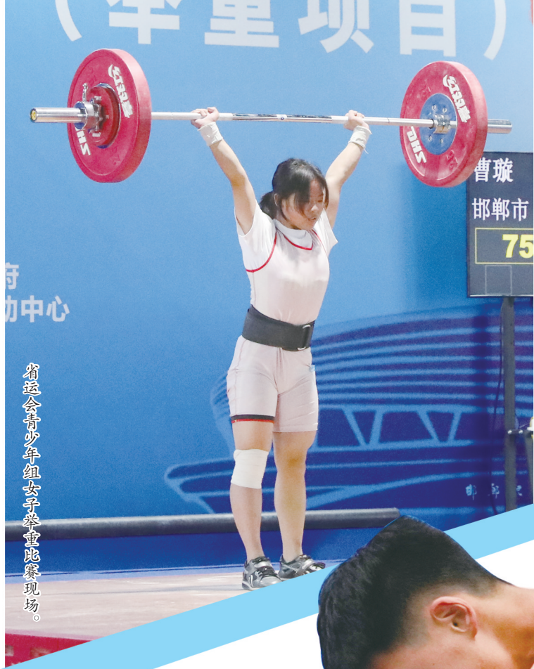
省运会青少年组女子举重比赛现场。