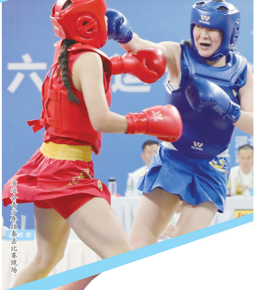
省运会青少年组拳击比赛现场。