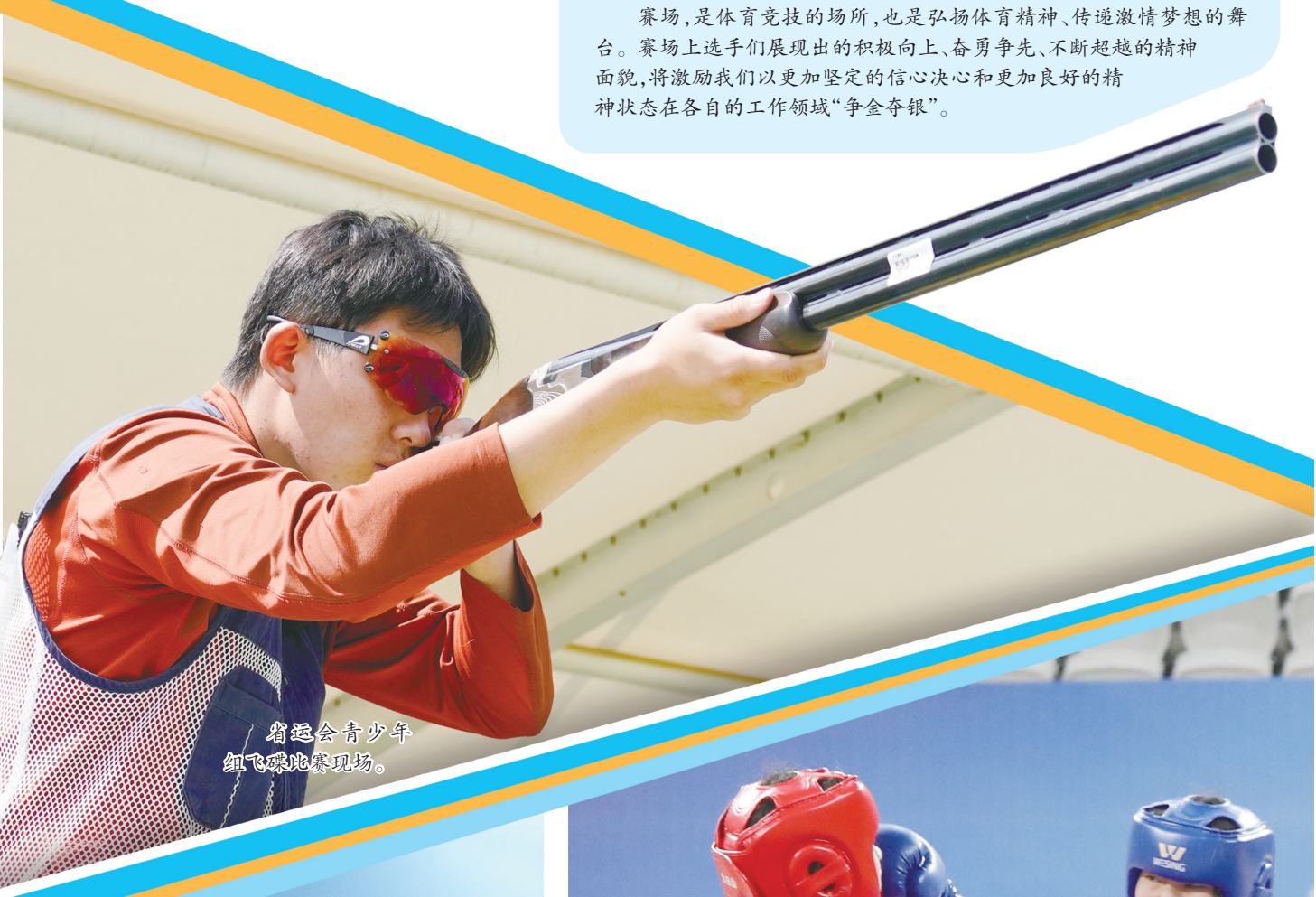
省运会青少年 组飞碟比赛现场。