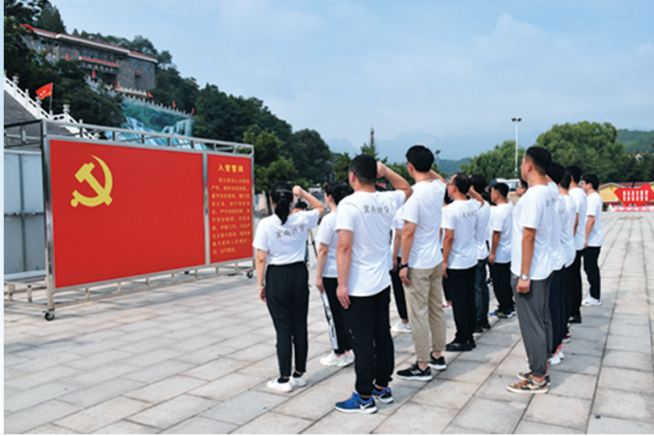
邢台银行组织员工到抗战纪念馆开展党建活动。