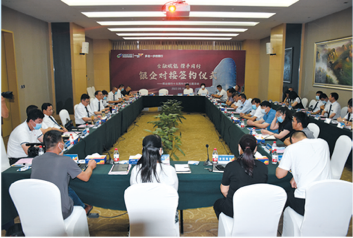
邢台银行举办“金融赋能 携手同行”签约仪式,为中小微企业解决融资难题。