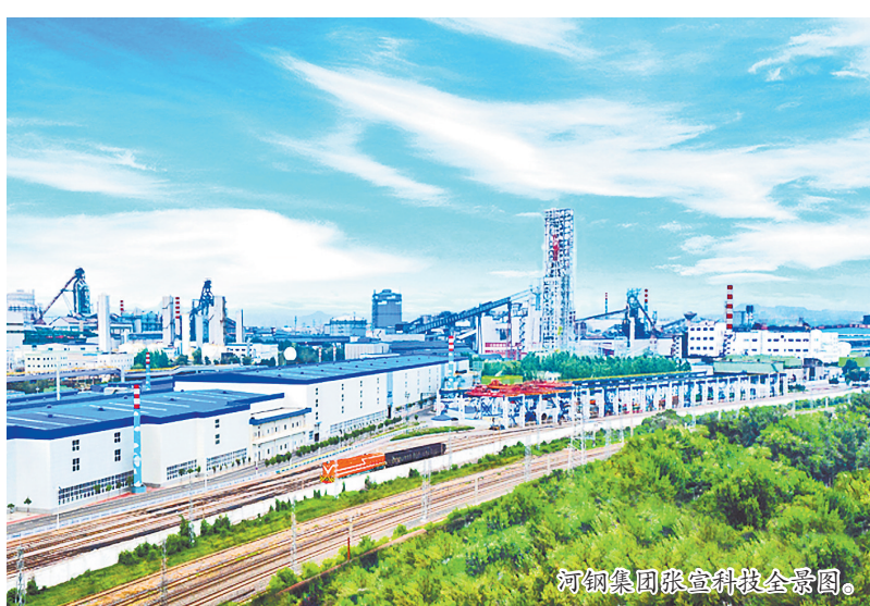
河钢集团氢冶金全景图。

近年来,河钢以践行“双碳”战略为牵引,充分发挥“绿色制造”和“制造绿色”双重效能,畅通“绿水青山”与“金山银山”双向转化通道,打造更加丰富、更加多元的绿色发展前景,释放更具引领性、更强竞争力的“绿动能”。