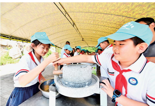
近日,400多名中小學生走进迁安市市乐研学与劳动实践教育基地,开展一日劳动研学游。图为孩子们体验用传统方法磨豆浆。

持续开展各类文化惠民活动,组织本区文艺志愿者深入乡村、社区、企业、机关等单位开展惠民服务,举办“奋楫前行 劳动光荣”“大雅国粹 戏韵飘香”“巾幗向党 奋进新征程”等“七进”惠民演出82场次,惠及群众1万余人次。开展民歌演唱、器乐演奏、花灯表演等各类讲座、培训130余场次,惠及群众2.7万余人次,面向群众发放文化惠民券12150张,让群众获得实实在在的文化实惠。