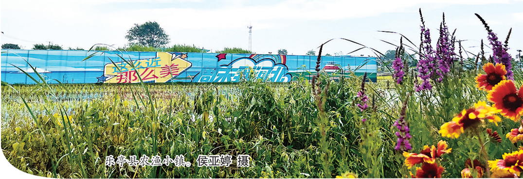
乐亭县农渔小镇。

作为传统农业大县,乐亭因盛产五谷,兼得渔盐之利,素有“冀东粮仓”“燕东天府”之称。如今的乐亭积极推动产业融合发展,全面建立旅游产品新体系,培育出“蓝绿红”个性化定制化线路,将境内的优质旅游景点以“一线串珠”的方式,串联成“渤海风情赶海拾趣游”“春色田园踏青采摘游”“追溯百年红色寻根游”三条特色精品旅游线路,唱响“这么近、那么美,周末到河北”的热情邀约。