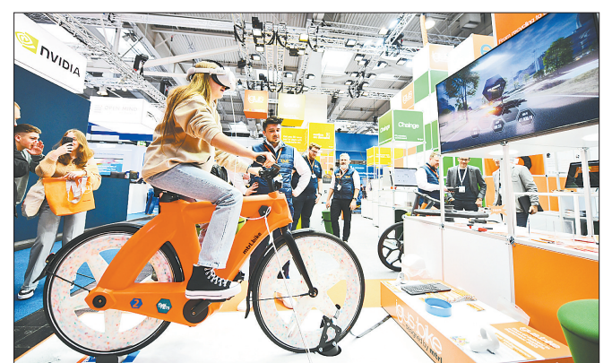
4月20日,在德国汉诺威工博会上,参观者骑在一款由回收塑料制成的自行车上体验VR游戏。2023年德国汉诺威工业博览会17日至21日举行。展会上众多可供互动的科技产品受到参观者青睐。