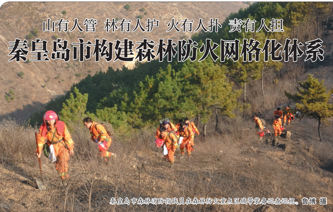
山有人管 林有人护 火有人扑 责有人担 秦皇岛市构建森林防火网格化体系

该局通过强有力的培训,不断提升基层监管执法人员专业素质,推动企业进一步落实安全生产主体责任,严防各类事故发生,确保全市安全生产形势持续稳定,为全市经济和社会发展创造良好的安全环境。