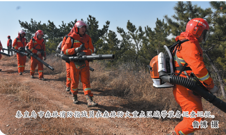
秦皇岛市森林消防指战员在森林防火重点区域带装备巡查巡护。

严格火源管控。按照全市2023年春季森林防火的命令要求,封闭涉林景区,在进山路口设置防火检查站,全市354个检查站24小时开展防火值守工作,对进入林区的人员、车辆进行检查,严防火种进山入林。市森防指成立由市应急管理、林业、公安、生态环境、旅游、民政等部门组成的联合督导检查组,由副县级以上领导带队,分包9个县区森林防火火督导工作,对防火责任落实、野外火源管控、旅游防火安全、禁止露天焚烧、文明祭祀等工作开展不间断督导检查。