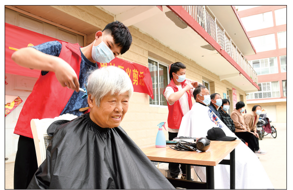
近日,大城县平舒镇祥和里社区联合一家理发店为社区居民提供爱心“义剪”,服务对象为60周岁以上的老年人。近年来,该县不断拓展服务领域和内容,让更多辖区居民得到关怀和实惠。图为志愿者给老人理发。

组织规划、建设等业务窗口实行并联办理、联审联批,通过“容缺受理+告知承诺制”,将预审意见作为下一步审批环节的办理依据,大大缩短项目审批时限。除内部配合外,霸州经济开发区行政审批局还积极与土地、建设等其他部门沟通,安排专人搞好对接,按照制定的项目推进工作清单,实时把握项目进度,确保各环节顺利推进。