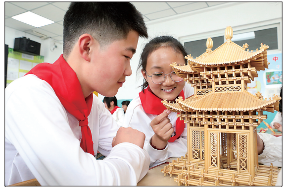
永清县积极开展各类“非遗进校园”活动,将秸秆扎刻、核雕等域内特色非遗项目引入课堂,让学生们近距离感受非遗魅力。图为学生正在欣赏秸秆扎刻作品“双子亭”。

信息消费作为创新最活跃、增长最迅猛、辐射最广泛的消费领域之一,在拉动内需、优化产业结构、促进消费升级等方面发挥着不可替代的作用。此次信息消费体验节,是廊坊落实党中央决策部署,着力加快恢复和扩大消费的务实举措,也是进一步推动信息消费升级的有力抓手。