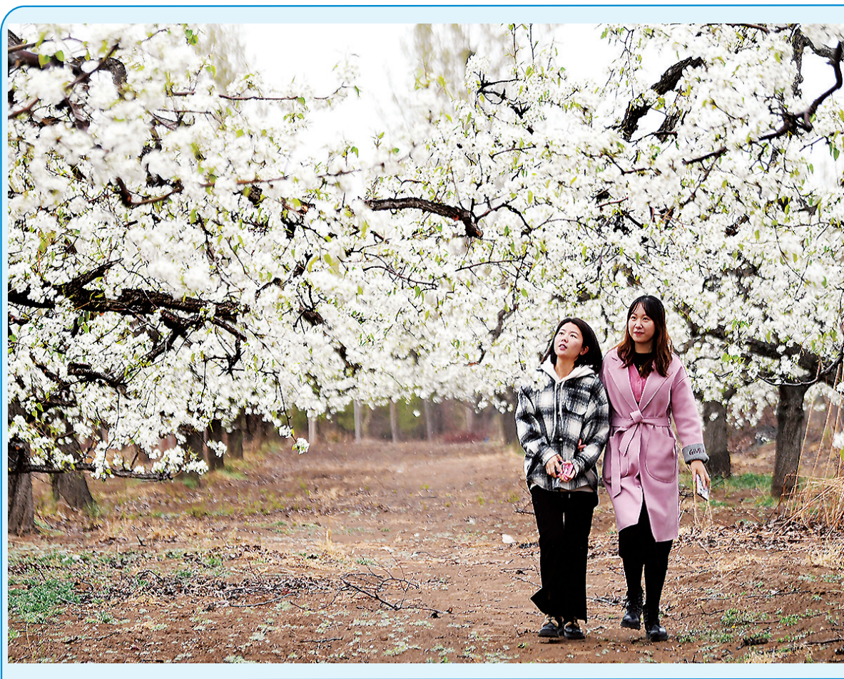
近日,廊坊市广阳区万庄镇韩各庄村的梨花迎春绽放,吸引不少游人前来观赏。该村以梨为媒,积极推动村街发展,除了吸引游客赏花,每年还有大量梨产品销往北京、天津、东北等地,经济效益非常可观,初步形成了春赏花、夏采果融合发展的乡村生态旅游。图为游客们一起欣赏满园梨花。

今年以来,廊坊开发区坚持党员干部带头讲、理论专家系统讲、文化骨干艺术讲、行业部门专业讲、特色群体集中讲,扎实开展“理响为民”宣讲活动,为干部群众送上富有吸引力和感染力的理论“大餐”。