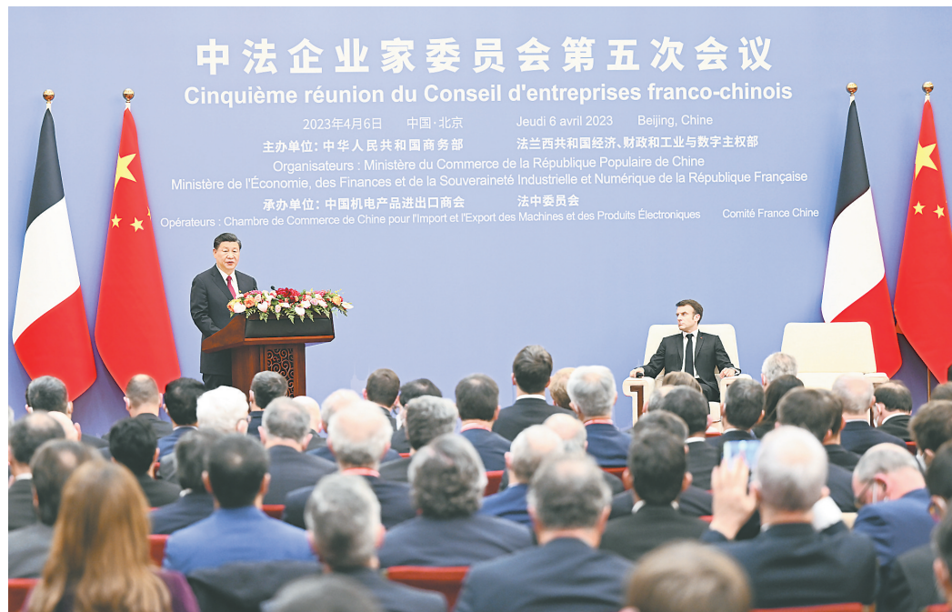
4月6日下午,国家主席习近平在北京同法国总统马克龙共同出席中法企业家委员会第五次会议闭幕式并致辞。

新华社北京4月6日电(记者刘华)4月6日下午,国家主席习近平在北京同法国总统马克龙共同出席中法企业家委员会第五次会议闭幕式并致辞。