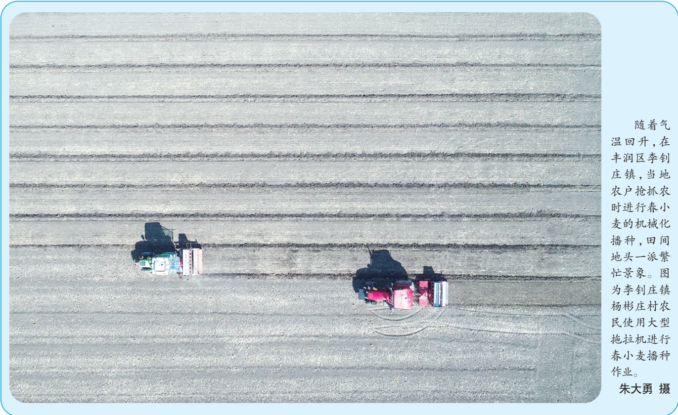
随着气温回升,在丰润区李钊庄镇,当地农户抢抓农时进行春小麦的机械化播种,田间地头一派繁忙景象。图为李钊庄镇杨彬庄村农民使用大型拖拉机进行春小麦播种作业。

本报讯(通讯员李颖 记者徐倩)2022年以来,路北区按照省市《城市公共厕所改造提升工程工作方案》工作要求,陆续新建公厕79座、提升改造老旧公厕83座。至今,路北区社会公厕达到210座,达标省市“建成区公厕达到每平方公里4座以上,人流密集的城市中心区、商业街区达到每平方公里6座以上”的标准要求。路北区在新建和提升改造公厕工作中,科学统筹,切实推进“厕所革命”。在点位选取和设计过程中,坚持市民需求优先、便民实用优先的“双优先”原则,内外兼修,注重实效。该区将粪污无害化处理技术直接应用在公厕上,向生态、环保、节能型公厕转型。同时,深化科技智能应用,研发使用微信“找厕所小助手”小程序,构建网络信息平台,让现代化公共卫生间绘制城市街景“新画卷”。