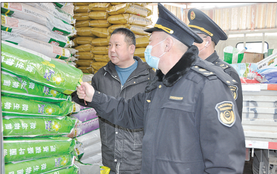
近日,迁安市市场监督管理局开展“查农资、保春耕”专项整治行动。目前,共检查农资产品生产、销售单位26家,对化肥、农膜等22个批次的农资产品进行了抽样。图为执法人员在各庄镇检查化肥氮磷钾含量。

以科技为第一生产力,以人才为第一资源,以创新为第一动力,处于“走向深蓝,向海图强”新发展周期的唐钢正开足马力,扬帆远航。