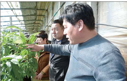
2月24日,开平区“高素质农民培育”活动正式开启,来自开平区各镇的100名农民将在为期10天的培训中,系统学习先进的农业生产技术,通过理论学习 and 实地参观拓宽视野,提高技能。图为种植专业合作社负责人为学员讲解水蜜桃种植知识。马靖铁 宋小健 摄

本报讯(通讯员纪业 郑鹤鸣 记者宋建军)2月22日,迁西县行政审批局举办行政审批业务大比武,活动以现场模拟的形式开展,根据参赛选手对审批办理事项的设定依据、申请条件、申请材料、办结时限等掌握程度,考察业务素质和工作能力。来自局内科室、进驻窗口、乡镇(街道)综合服务中心的24名参赛选手同台竞技,展现了各自的理论水平、业务水平和精神风貌,得到现场评委和观众的一致好评。经过激烈角逐,共有13名同志分别获得一、二、三等奖,其中税务窗口的刘明秀以97.8分的全场最高成绩获得了冠军。此次比武全面落实该县高质量发展暨优化营商环境大会各项决定,擦亮“投资来迁西,事事都顺利”营商环境品牌,切实提升了政务服务系统工作人员的业务能力。