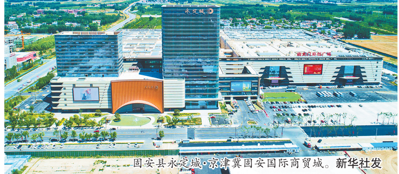
固安县永定城·京津冀固安国际商贸城。

如今,首衡河北新发地已经构建了覆盖果蔬、干副、调料、花卉、冻品等多种业态,成为京津冀地区业态最多、