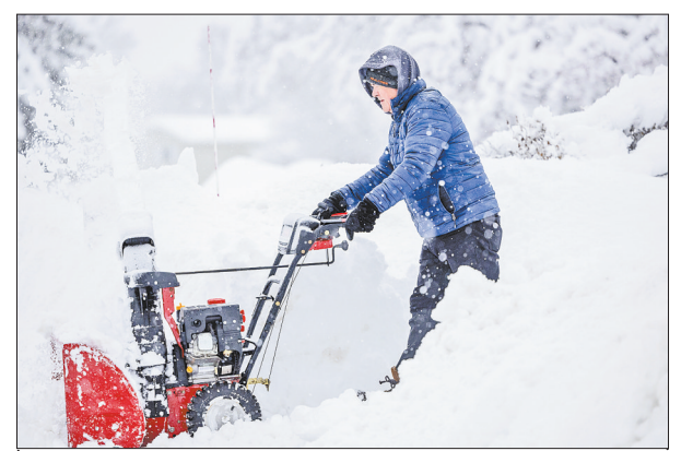
1月4日,在美国明尼苏达州阿普尔谷,当地居民从积雪中开出一条道路。美国多地新年第一周遭遇新一轮冬季风暴,中北部3日出现大雪、冻雨、雨夹雪,南部大片地区面临龙卷风和洪水威胁,多地发布天气预警。