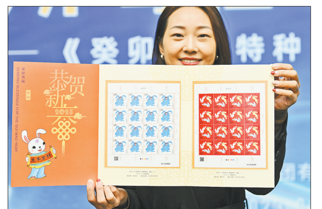
1月5日,一位购买邮票的女士在首发仪式上展示成套整版的《癸卯年》特种邮票。中国邮政5日发行《癸卯年》特种邮票。邮票一套两枚,分别名为“癸卯寄福”“同圆共生”。《癸卯年》特种邮票是中国生肖邮票第四轮的第八套,票面图案由年近百岁的艺术家黄永玉绘制。

新华社北京1月5日电(记者戴小河 马晓澄)国家药监局4日应急批准深圳汉诺医疗科技有限公司体外心肺支持辅助设备、一次性使用膜式氧合器套包注册申请,二者配合使用,用于急性呼吸衰竭或急性心肺功能衰竭、其他治疗方法难以控制并有可预见的病情持续恶化或死亡风险的成人患者。作为国产首个ECMO设备和耗材套包,上述产品具有自主知识产权,性能指标基本达到国际同类产品水平。 其中,体外心肺支持辅助设备由主机、泵驱动装置、紧急泵驱动装置、备用电池、流量气泡传感器等组成。一次性使用膜式氧合器套包由膜式氧合器及动静脉管路组件、预充管路组件、配件包组件和氧气管路组成。 ECMO产品作为常规治疗无效的危重症新型冠状病毒感染患者的挽救性治疗设备,是新型冠状病毒感染治疗方案中明确的治疗措施,国产产品的上市对于满足临床急需,保障重症患者治疗,确保疫情防控“保健康、防重症”目标落实,将发挥重要作用。