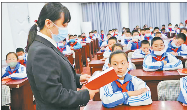
针对青少年学生世界观和人生观尚未成熟需要正确教育和引导的特点,日前,丰宁满族自治县法院联合县司法局到县实验小学开展“送法进校园,关爱护成长”法制副校长普法宣讲活动,在宣讲法律知识的同时,为现场的师生发放了《民法典》及校园安全小册子。通过对这些法律知识的讲解,切实提高同学们抵制各种不良行为的能力。

本报讯(记者吴新光 通讯员王千 张威 李哲 安可心)近日,河北省光伏产业用地遥感智能解译模型由省自然资源利用规划院构建完成,经过实地验证、测试,智能解译精确度达到85%以上。 据了解,遥感智能解译技术是卫星遥感技术发展的重要方向,自然资源部多次强调要加强监测技术探索与创新,要求开展影像信息智能化提取和解译等关键技术研发。在河北省自然资源厅科技外事处的大力支持下,省自然资源利用规划院今年开展了遥感智能解译技术创新攻关,在河北省率先利用高分辨卫星遥感数据构建了光伏产业用地遥感智能解译模型样本库。经过多轮模型推演,形成了适合河北省特点的光伏产业用地遥感智能解译模型,为河北省光伏产业用地规范管理提供了技术支撑。