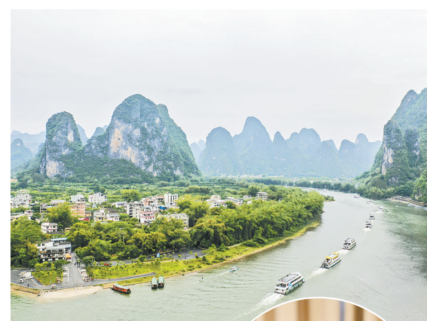
上图：漓江广西阳朔段。