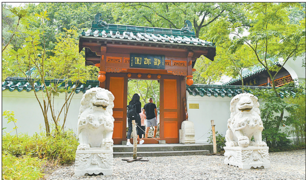
8月17日,游客在德国杜伊斯堡郭趣园参观。在中德两国专家为期数月的全面修缮下,坐落在德国杜伊斯堡市动物园内的中国园林郭趣园17日重新开放,迎接游客到来。

据新华社北京8月18日电 记者18日从财政部了解到,财政部、应急管理部17日紧急下达4.2亿元中央自然灾害救灾资金。其中,预拨2.1亿元,支持安徽、江西、湖北、湖南、重庆、四川、新疆等7省(区、市)做好抗旱救灾工作,重点解决城乡居民用水困难等问题;预拨2.1亿元,支持河北、山西、山东、河南、黑龙江、内蒙古、陕西、甘肃等8省(区)开展防汛救灾工作,由地方统筹用于应急抢险和受灾群众救助。 截至目前,财政部、应急管理部已预拨地方防汛抗旱资金13亿元,其中防汛救灾资金10亿元、抗旱救灾资金3亿元。