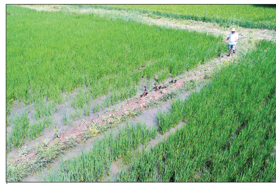
怀来县大黄石镇朱官屯村探索推行“稻鸭共生”生态种养新模式,不施农药和化肥,创造良好的生态种养环境。目前,该县已在50余亩稻田中喂鸭600余只鸭子。图为鸭子在稻田中嬉戏觅食。