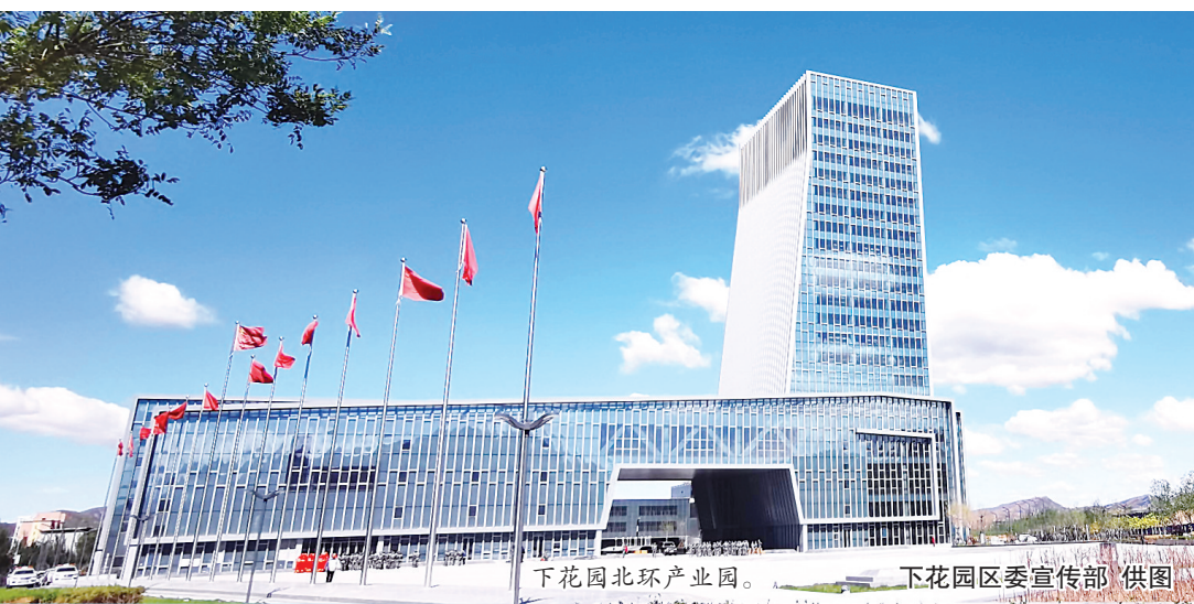
下花园北环产业园。