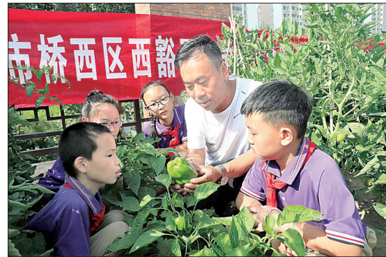
日前,桥西区西豁子小学在校区内“劳动实践基地”组织开展了“快乐种植 快乐实践”蔬菜采摘活动。图为张家口市农科院专家为孩子们讲解相关知识。

时,该县政策优势明显,营商环境优越,对引进和落地新兴工业类项目、农牧类项目、文化旅游类项目等,逐一明确扶持优惠政策,最大限度地给予企业在资金、人才等方面的支持,从优化市场环境、政务环境、创新环境等5个方面,细化出台了68条具体措施,为企业落户、项目落地提供全方位的服务保障。