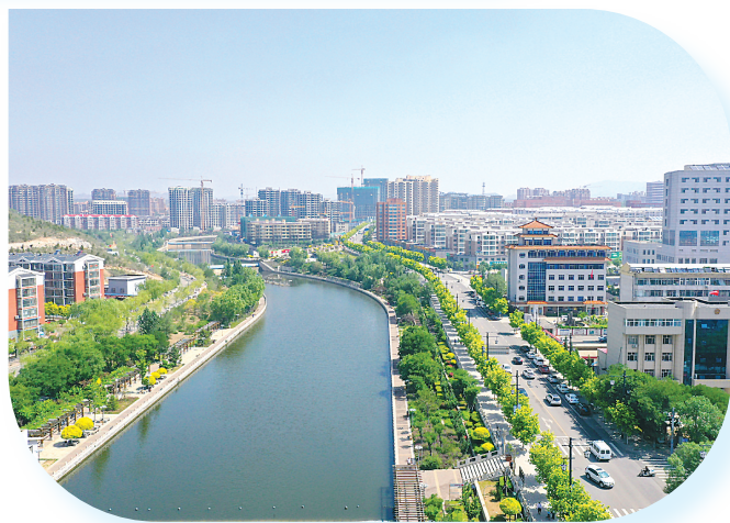
治理后的戴家营河。

该区深入践行“两山”理论,深入挖掘“七分山水两分园”的自然资源禀赋,大力实施生态强区战略。加大生态环境综合治理力度,实施矿山地