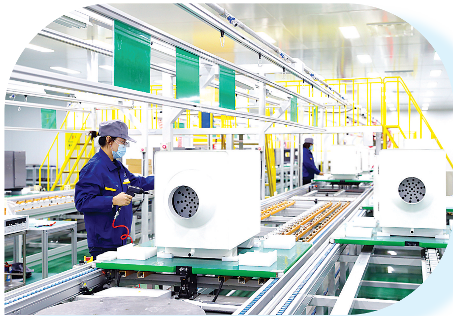
位于下花园经济开发区的奥登(中国)有限公司,工人在生产空气净化产品。

该区坚决淘汰污染企业和落后产能,充分考虑土地、环境承载能力,努力培育现代制造、数字经济等战略性新兴产业。同时,该区积极搭建产业集聚发展平台,在煤矿废弃土地上建设标准化厂房5万平方米、园区路网体系近20公里,建成了集科技高端化、产业集群化为一体的省级经济开发区,吸引31家企业入驻,推动产业实现集约化、特色化发展。另外,该区还大力发展文化旅游、医疗康养等特色服务业,推动段家堡健康养生旅游、中国(京北)航天科技文旅城、万和红色军事体育科技园等一批文旅项目落地,打造全域旅游