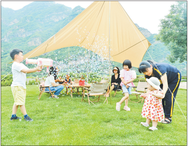
7月2日,游客在野三坡景区露营基地休闲玩耍。

具体到部分主要船型和航线,6月28日与6月21日相比,秦皇岛至广州航线5-6万吨船舶的煤炭平均运价报39.9元/吨,环比上行2.8元/吨;秦皇岛至上海航线4-5万吨船舶的煤炭平均运价报30.4元/吨,环比上行5.1元/吨;秦皇岛至江阴航线4-5万吨船舶的煤炭平均运价报32.5元/吨,环比上行5.2元/吨。