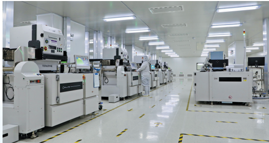
唐山国芯晶源电子

玉田区位优势明显，地处京津唐“金三角”中心地带，距北京通州70公里、天津中心城区110公里、唐山市区55公里。玉田交通路网四通八达，毗邻天津港、曹妃甸港、京唐港、秦皇岛港四大港口，距离均在150公里以内；距离首都国际机场、大兴机场、天津均在120公里以内，距离唐山机场仅有30公里；京哈、京秦、唐承、长深高速依境而过，102国道横贯东西；大秦铁路、京秦铁路、京唐城际铁路及规划中的津承、唐承两条高铁均在玉田设站，地处“京津半小时经济圈”的玉田，承接京津产业转移的桥头堡作用日益彰显。