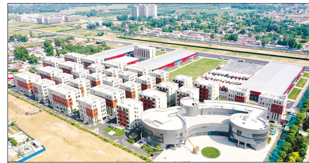
近日，保定市首个中央厨房预制菜产业园区——首衡预制菜加工产业园正式揭牌。产业园占地42.5万平方米，总投资21.5亿元，着力构建“食品研发、预制菜加工、中央厨房、集配中心、电商直播、检验检测”六位一体的现代化预制菜产业集聚区。

本报讯(通讯员吕穆祥)近日，保定银保监分局开展打击整治养老诈骗专项行动。该局成立领导小组，印发系列文件，明确工作要求，建立周报告制度，督促各银行保险机构积极发挥在大数据资金监控和异常资金账户监测等方面的专业作用，督促辖内银行保险机构积极协助政法机关开展工作。