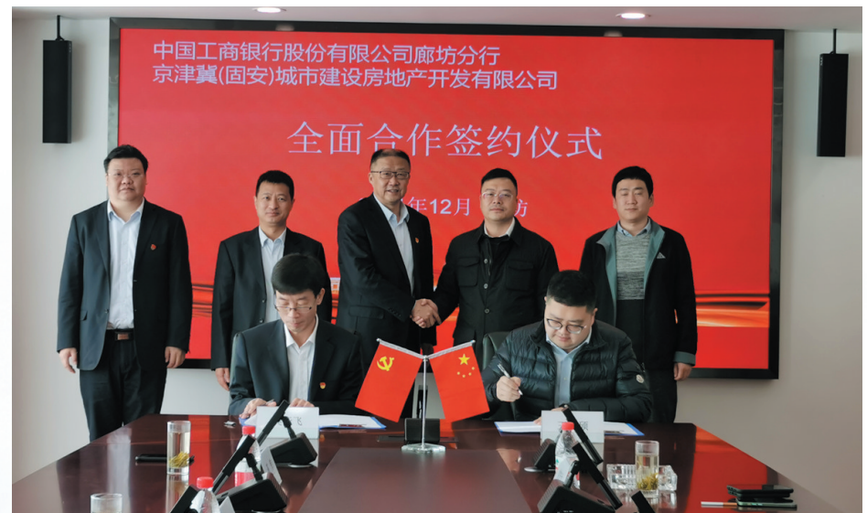
工行廊坊分行与京津冀(固安)城市建设房地产开发有限公司全面合作签约

收费减免，出台了免收小微企业对内保函服务费等多项政策，取消或主动承担了小微企业的贷款抵押登记费、评估费、抵押财产保险等多项费用。该行还积极开展中小微企业贷款延期还本付息工作，对直接或间接受疫情影响的有贷户提供差异化金融服务。截至5月末，该行办理中小微企业贷款延期还本2笔，金额近500万元。(袁博 杜文竹)