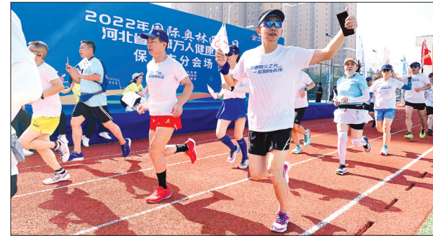
6月23日是国际奥林匹克日。保定在全市范围内开展系列活动，来自全市的跑步爱好者们以饱满的状态激情开跑；同时，该市22个县(市、区)、开发区同步开展全民健身活动，掀起全民健身新热潮。