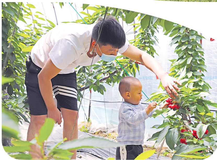
▲中国农业大学涿州现代农业示范区里的节水灌溉设备。一位家长带着孩子在观光农业大棚里摘樱桃。

在承接北京非首都功能疏解、推动京津冀一体化发展的生动实践中，涿州市着力打造央企总部“金饭碗”，深化与中国五矿、中国船舶、中国农大、中国钢研、央视等单位的战略合作，加