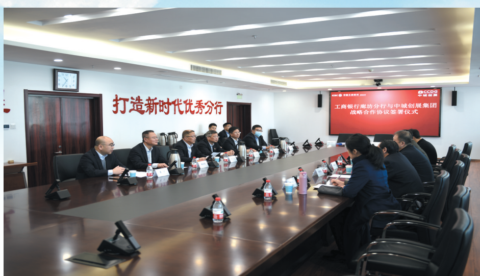
工行廊坊分行与中城创展集团合作签约会

担公司驻廊坊办事处人员为小微企业主现场宣讲“河北农担贷”业务，提供小额贷款服务指导。通过建立专门工作机制，优化产品结构，全面提升服务乡村振兴质效。截至5月末，普惠型涉农贷款余额达10.78亿元，较年初增加2.49亿元，普惠型涉农贷款增长明显。