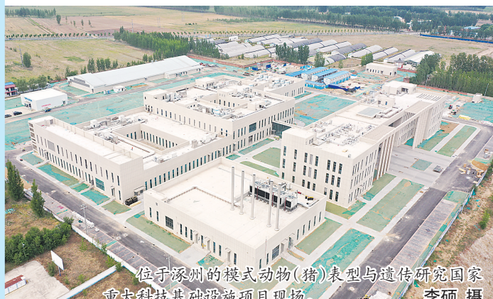
位于涿州的模式动物(猪)表型与遗传研究国家重点科技基础设施项目现场。

此外，涿州市以承办第六届保定市旅发大会为契机，聚焦城市管理“新颜值”行动，紧抓老城提升、新城扩容、园区挖潜、乡村增效等重点工作，形成多点发力、竞相出彩的生动局面。同时，进一步深化与华侨城、中冶集团等单位合作，大力实施三义宫改造提升、鼓楼大街南延北拓、影视郊野公园、一担粮文化园等一系列工程，打造精品文化旅游路线，推动全市文旅产业高质量发展，努力把“全国优秀旅游城市”“中国三国文化之乡”“千年古县”“河北省历史文化名城”四个金字招牌擦得更亮。