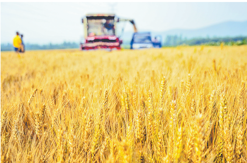
6月19日,遵化市刘寨寨乡的农民将收获的小麦装车。

“实现更高层次发展,必须进一步解放思想、奋发进取。”省粮食和物资储备局粮食储备处处长王雪松表示,下一步,要把贯彻落实好全会精神作为主线,着力筑牢粮食安全“压舱石”,组织好夏粮收购,确保收获的粮食颗粒归仓,切实维护种粮农民利益,保障居民消费需求,实