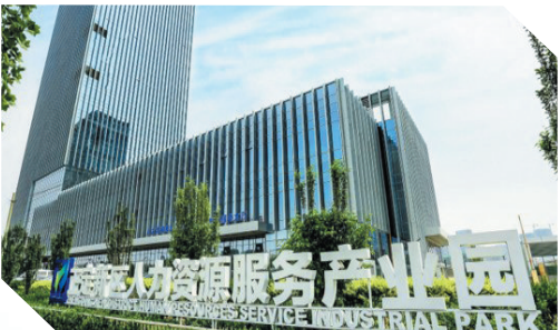
人力资源服务产业园