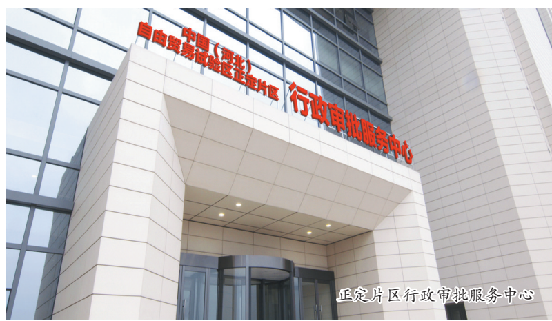
正定片区行政审批服务中心

全面深化“放管服”改革,积极探索工程建设项目审批改革服务,在项目建设全流程提供“店小二”式跟踪服务,推出“秒批秒办”审批模式10项措施,相关部门提前介入、指导帮扶,采用集中预审、信息互通、关联审批新模式,