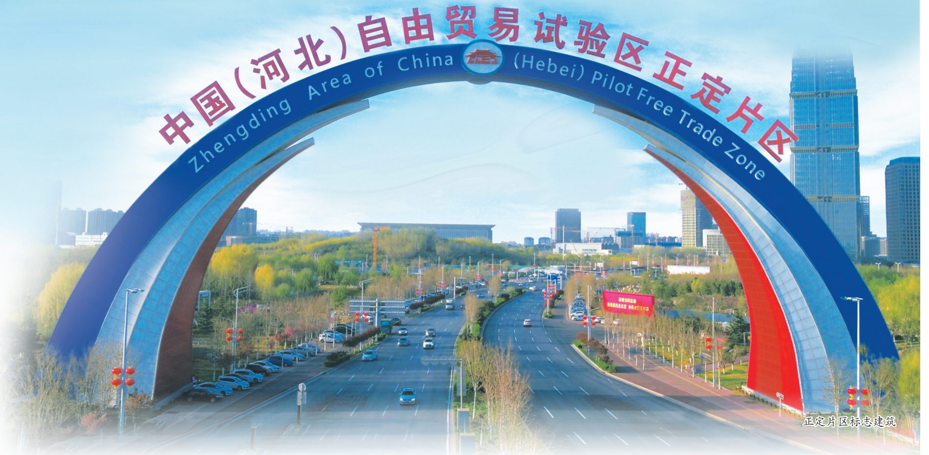
正定片区标志建筑