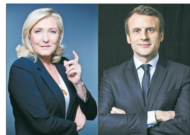
这张4月10日制作的拼版照片显示的是，法国总统马克龙(右)和极右翼政党“国民联盟”候选人玛丽娜·勒庞。根据法国媒体10日晚公布的出口民调结果，现任总统埃马纽埃尔·马克龙和极右翼政党“国民联盟”候选人玛丽娜·勒庞在当天举行的法国总统选举首轮投票中得票领先，将进入第二轮投票。

10日上午，“冰丝带”赛时照明全开，给予“家人”最高礼遇。建设者张博伟(中)与家属在国家速滑馆“冰丝带”内合影留念(4月10日摄)。