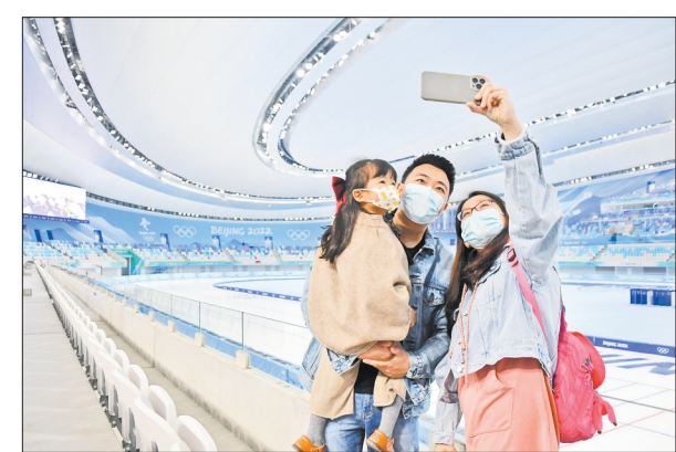
北京冬奥会上，历时5年建成的国家速滑馆“冰丝带”助力中外健儿屡创佳绩，广大场馆建设者功不可没。4月10日，场馆暖心邀请建设者代表及家属“回家看看”，共同分享这份冬奥荣光。

据了解，相比于普通药品进口，跨境电商方式采用1210模式，消费者在线上下单支付后约2分钟，药品便可完成通关。同时，药品从生产厂家直达零售企业，实施特殊税收政策，让药品进口“更快、更省、更放心”。