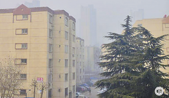
图①为2014年12月27日拍摄。图②为2019年12月27日拍摄。图③为2019年12月27日拍摄。图④为2021年12月27日拍摄。