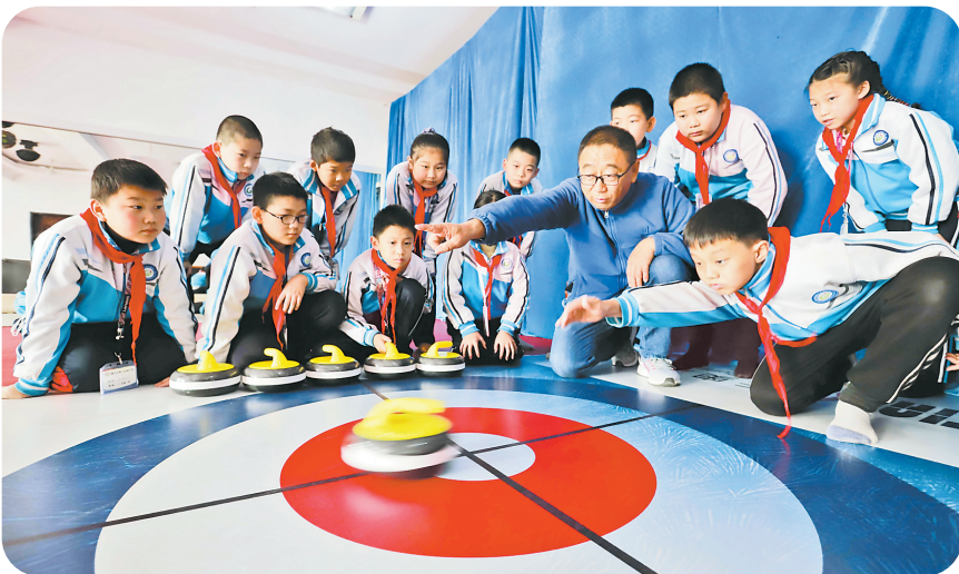
唐山遵化市第三实验小学的老师指导学生投掷陆地冰壶。

冷继英指出,确保“双减”政策切实落地,也需要家长认识到“双减”的必要性,不能以牺牲孩子身体健康为代价来提高分数。另外,教育行政部门也要加大对音乐、美术、体育等必要资源的教师招聘和培训力度,满足开展“三点半”特色课堂的需求,促进学生五育并举、全面发展。