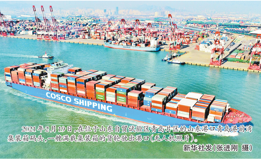
2021年2月19日,在位于山东自贸试验区青岛片区的山东港口青岛港前湾集装箱码头,一艘满载集装箱的货轮驶出港口(无人机照片)。

受原材料成本上涨及疫情、汛情影响,前三季度我国固定资产投资同比增速较上半年有所放缓,四季度资本形成总额对经济增长贡献率为负。