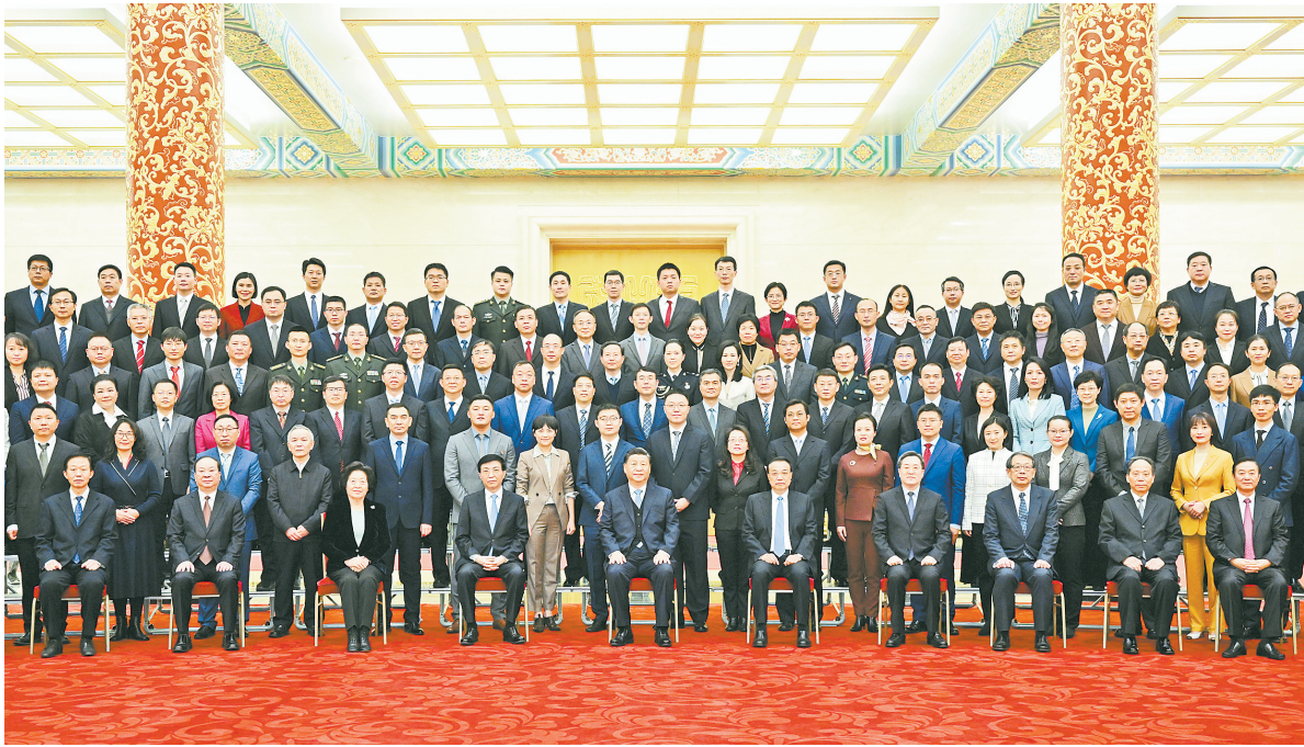
12月15日,党和国家领导人习近平、李克强、王沪宁等在北京人民大会堂会见中华全国新闻工作者协会第十届理事会第一次会议暨中国新闻奖颁奖会代表。

新华社北京12月15日电 中华全国新闻工作者协会第十届理事会第一次会议暨中国新闻奖颁奖会15日在京举行。中共中央总书记、国家主席、中央军委主席习近平在人民大会堂亲切会见会议代表,向他们表示诚挚问候和热烈祝贺。 中共中央政治局常委李克强、王沪宁参加会见。 下午3时10分,习近平等来到人民大会堂金色大厅,全场响起热烈