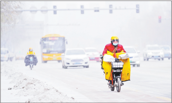
11月22日,在哈尔滨市,骑手在雪中行进。当日,黑龙江省多地出现暴雪。黑龙江省气象灾害应急指挥部已启动重大气象灾害(暴雪)Ⅱ级应急响应,全力应对暴雪天气。

标准对船员在新冠肺炎疫情期间在船工作涉及的各方面特殊情况进行了详细约定,包括船舶防疫用品配备、船员在集中隔离医学观察或境外滞留期间的相关费用、船员防疫补贴和疫情期间伙食补贴等内容,为确保船员的工资收入、休息休假等权益和在船生活质量提供了依据。