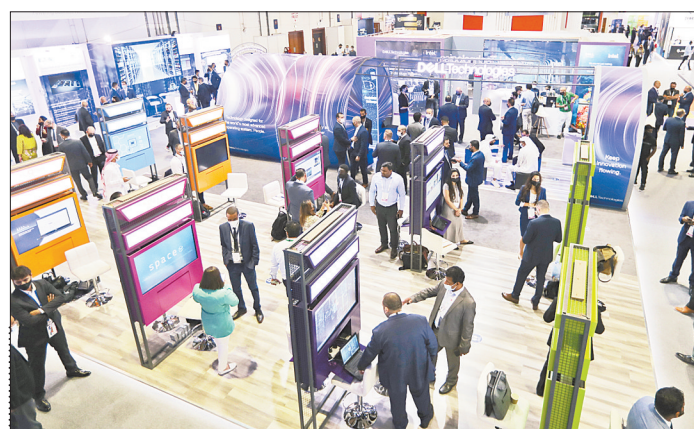
10月17日,人们在阿拉伯联合酋长国迪拜参观GITEX消费电子展。2021迪拜GITEX消费电子展于10月17日至21日举行。