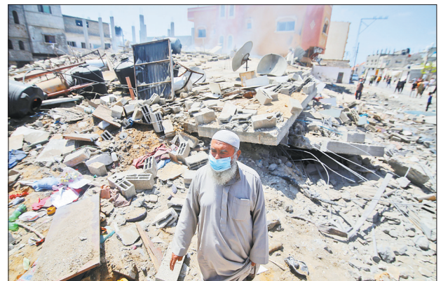
5月20日,巴勒斯坦人在加沙地带的拉法查看以色列空袭后的建筑废墟。以军从10日开始的这轮空袭和炮击迄今已造成巴方至少227人死亡,其中包括64名儿童和38名妇女。

(上接第一版)建立健全激励约束的考核评价机制。将扫黑除恶专项斗争纳入平安中国建设考评体系,作为平安中国建设评选表彰的重要依据,对成绩突出的地区、单位和个人进行通报表扬,对不担当、不真打、不深打的后进地方重点通报督办,倾听群众评价,致力问效于民,推动建立健全黑恶势力违法犯罪问题倒查机制,建立健全持续深入推进的组织领导机制。参照原有全国扫黑除恶专项斗争领导小组组成和分工,中央成立全国扫黑除恶专项斗争领导小组及其办公室,各级党委和有关部门保留相应领导和办事机构,把扫黑除恶专项斗争纳入经济社会发展全局谋划推进,加强综合保障,强化专业队伍,加强正面宣传,增强人民群众运用法律与黑恶势力作斗争的信心和能力。