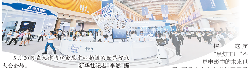
5月20日在天津梅江会展中心拍摄的世界智能大会会场。

从“刷脸”乘车到车路协同的无人驾驶,从智能家居到万物互联的智慧城市,在移动互联网、大数据等新技术驱动下,人工智能科技近年来不断跃升,正以前所未有的速度和广度,深刻改变着我们的生活和经济发展。