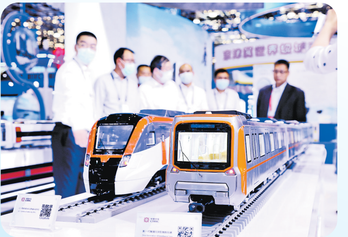
中车唐山公司展位。

市综合治理能力,切实提升了市民的获得感、安全感和幸福感。”华为公司河北副总经理南志刚说。