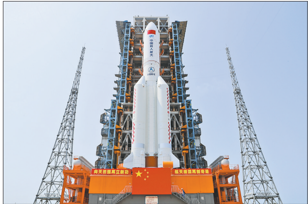
4月23日,空间站天和核心舱与长征五号B遥二运载火箭组合体已转运至发射区。目前,发射场设施设备状态良好,工程各参研参试单位正在全力备战。

工信部也与相关部门建设短缺药品多源信息采集和供应业务协同应用平台,动态掌握集中生产基地小品种药的生产和库存情况。截至2020年底,6家小品种药联合体实现了100种小品种药的生产目标。