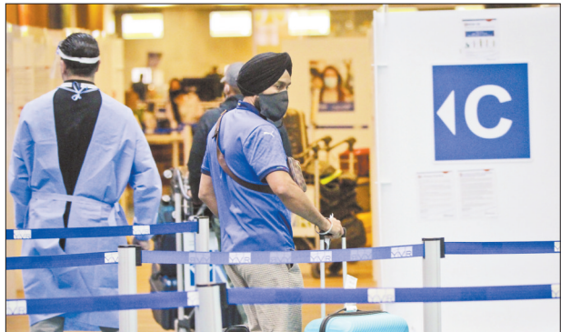
4月23日,来自印度的旅客抵达加拿大温哥华国际机场,准备进行新冠病毒检测。为防止变异病毒传入,加拿大政府22日宣布,30天内暂时禁止来自印度和巴基斯坦的客运航班入境。