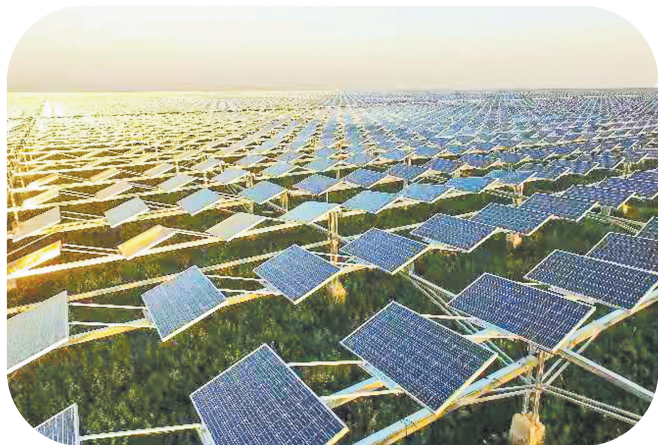
光伏板下种枸杞,将光伏发电、生态农业有机结合起来。