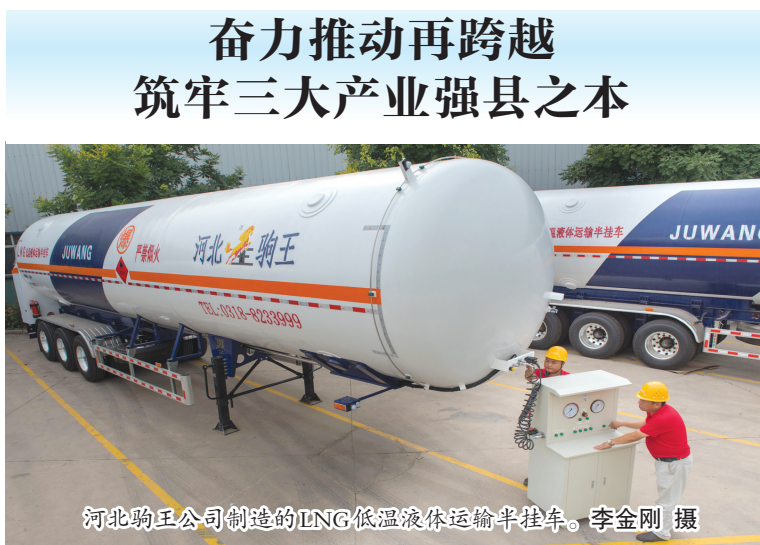
河北驹王公司制造的LNG低温液体运输半挂车。

“站在‘十四五’开局之年的新起点上，枣强的发展也迎来重要的历史机遇期。”枣强县委、县政府领导信心满满。该县深入开展“三重四创五优化”活动为契机，立足枣强实际，加快转型升级，重塑裘皮服装服饰、复合材料、智能装备制造三大产业的产业链、供应链、价值链，以产业转型脚足强劲的发展动力，发展质量更高、发展后劲更足。 2020年，枣强县编制了三大特色产业发展规划，成立4个省、市级行业协会，裘皮服装服饰、复合材料产业被列为省级县域特色产业集群，以“枣强速度”“枣强魄力”深入实施民营企业“百千万”提升工程，明确提出以更加坚定的决心、更大的勇气和智慧，奋力打造枣强区域特色产业发展升级版。打造产业升级版，在枣强人看来，不只是一句口号、一句“流行语”，更是冲锋的号角、催征的战鼓。号角声中，枣强聚集新的动能，战鼓声里，原有的皮毛、玻璃钢、机械制造三大产业升起新的希望。 如何使产业升级，枣强充分发挥创新引领、合作共赢和项目招商的叠加优势，激活“二次创业”的新引擎，开启“二次创业”的新征程，奏响了产业升级的华美乐章。 坚持创新引领，着力加快动能转换。枣强抢抓京津冀协同发展和雄安新区辐射带动双重战略机遇，加快衡水创新港建设，实施创新主