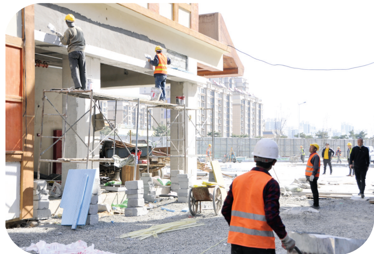
按照唐山市重点项目集中开工安排,迁安中唐·天元谷度假区项目建设进展顺利。该项目占地437亩,总面积15.6万平方米,总投资17亿元,为全国优选旅游及河北省重点项目。目前,已完成投资15亿元。今年,计划投资2亿元,用于“一谷两区一岛”的建设升级,同步完成项目建设期向景区运营期转变。

社会安全治理方面,计划投资5000万元为158个居民小区安装智能前端感知设备,切实增强小区安全防护、预警、预防能力;计划投资3860万元实施老旧小区改造提升项目;计划投资674万元,实施应急广播体系建设项目,提升应急信息发布能力。