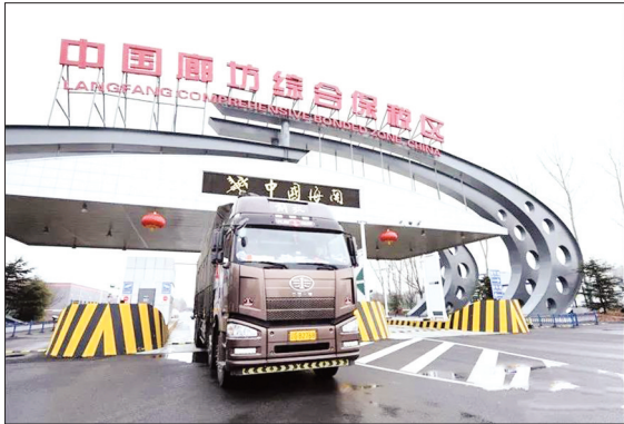
近日,一辆装载非保税红酒的车辆通过卡口,驶出廊坊综合保税区,标志着“仓储货物按状态分类监管政策”在该保税区正式落地实施。由此,该保税区成为河北关区首家成功开展按货物状态分类监管业务的综合保税区。

小微企业,一直以来都是税务部门重点关注、服务的对象。疫情期间,很多小微企业受到影响,陷入发展困境。该市税务局不断扩大合作银行范围,缓解小微企业、民营企业融资难题,扩大“银税互动”受惠群体。他们积极与建设银行、邮储银行开展“银税互动”对接合作,联合制发工作方案。邮储银行三农金融部根据其提供的全市A、B、M级纳税人名单,主动联系企业,有针对性地推荐贷款产品。目前,全市共有8家银行金融机构为3063户企业发放贷款16.3亿元。