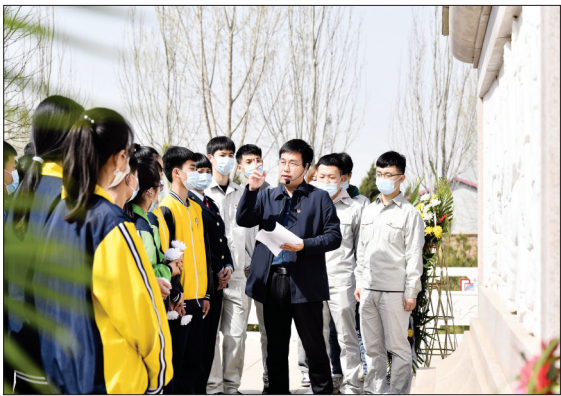
近日,共青团文安县委组织中学生及青年代表共60余人,到该县烈士陵园向革命先烈敬献花篮,并重温入党誓词。图为该县退役军人事务局局长讲述革命英烈事迹。

本报讯(通讯员董旭旭 徐巍)近年来,霸州市统筹实施乡村振兴战略,深化农业供给侧结构性改革,提升农业发展质量,稳定粮食生产,保障重要农产品供给,抓好农村人居环境整治,推动农业农村稳步发展。该市通过政策引导、争取资金扶持等方式,不断发展壮大龙头企业;引导龙头企业通过“公司+农户”“公司+基地+农户”“公司+合作社+农户”等形式,与农户结成利益共同体。截至去年底,该市共有廊坊市级以上农业产业化重点龙头企业15家。其中,国家级1家,省级5家,廊坊市级9家,龙头企业经营整体规模有了较大提升,带动农民致富能力不断增强。农业产业化经营率由2015年底的39%增长到44%。