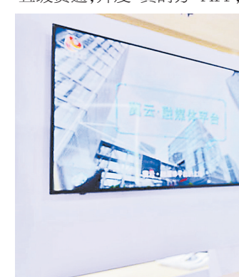
冀云·融媒体平台参展第三届数字中国建设成果展览会。

持续推进“互联网+政务服务”,建成全省一体化在线政务服务平台,实现省、市、县、乡、村五级贯通,开发“冀时办”APP,