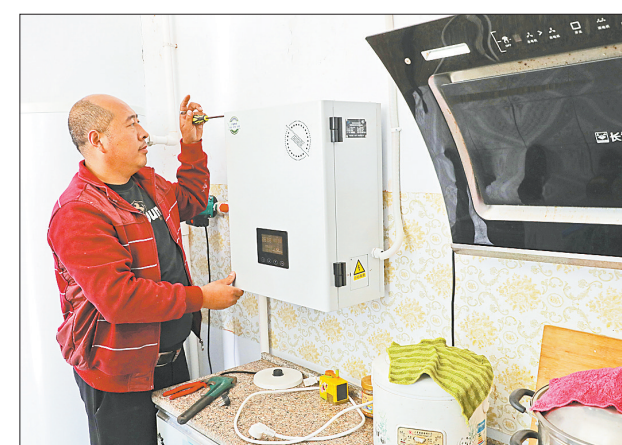
10月12日,工作人员在张家口经济开发区沈家屯镇农家村入户进行“电代煤”供暖设备调试。近日,张家口市最低气温达零度以下,各集中供暖企业提前进行设备检修维护和升级改造,农村“电代煤”等清洁能源供热工程也在加紧安装调试,确保如期供暖。

截至9月30日,全省共有市级冰雪轮滑类协会25个县(区)级冰雪轮滑类协会112个,除石家庄市、定州市和辛集市外,11月底全省应有67个县(区)需要完成对协会的设立。