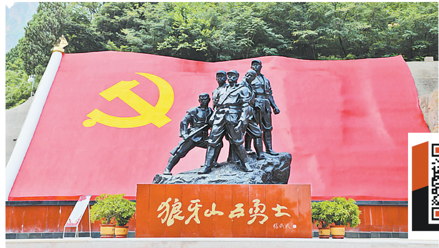
像纪念碑。狼牙山五勇士铜像。

守狼牙山。掩护大部队,完成了阻击战!”这是狼牙山镇陈家会村村民李玉强自编自说的快板。60岁的李玉强是一位“兼职记者”,自上世纪80年代开始,他走遍了狼牙山地区的每一寸土地,记录着一个又一个可歌可泣的英雄故事。李玉强采访了当年救下葛振林和宋学义的余药夫。余药夫为他讲述了发生在79年前的那一幕。1941年9月25日,日伪军约3500余人围攻易县城西南的狼牙山地区。(下转第四版)