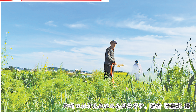
御道口村村民在湿地公园做管护。

流水潺潺,绿草如茵,花儿竞相开放,鸟儿尽情欢唱……很难想象,这个居民、游客休闲观光的好去处——小滦河国家湿地公园,曾是附近村民耕种放牧的地方。(下转第二版)