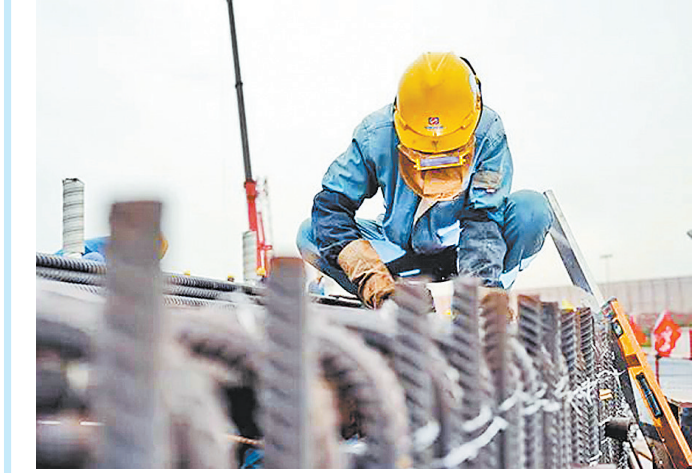
工人正在对钢筋进行焊接。

本报讯(记者赵晓慧 通讯员齐波)河北港口集团秦皇岛海运煤炭交易市场发布,8月5日至11日,环渤海动力煤价格指数报收于544元/吨,环比下行1元/吨。