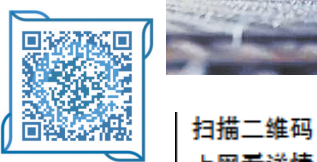
扫描二维码 上网看详情